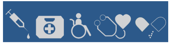
Ffigur 10: Gweithio i Wella Cymru, Llywodraeth Cymru, 2018.

Mae Rheoliadau'r Gwasanaeth Iechyd Gwladol (Pryderon, Cwynion a Threfniadau Gwneud Iawn) (Cymru) 2011 yn ei gwneud yn ofynnol i gyrff y GIG wneud trefniadau ar gyfer trin ac ymchwilio i gwynion. Gelwir y trefniadau hyn yn Gweithio i Wella.