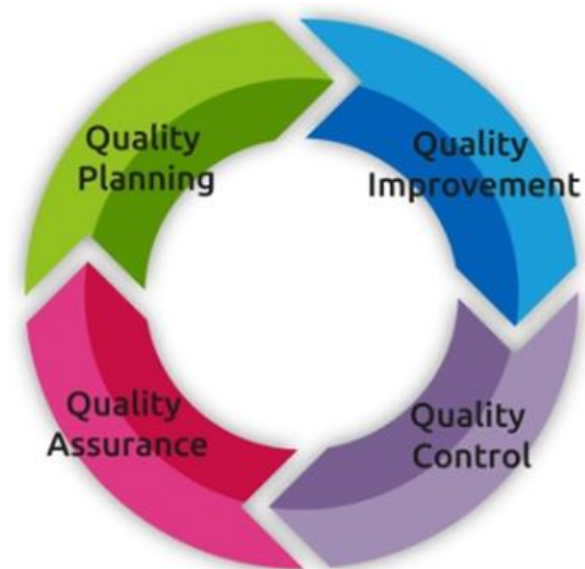
Ffigur 2: Diagram i ddangos y cysylltiad rhwng pedair cydran System Rheoli Ansawdd

Nid haen ychwanegol o lywodraethu neu adrodd yw'r model System Rheoli Ansawdd, ond yn hytrach set o egwyddorion y bydd y Bwrdd Iechyd yn eu defnyddio i edrych ar ei agwedd at ansawdd ar lefel sefydliadol a lleol. Mae'n