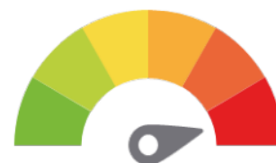
Ffigur 9: Dyletswydd Gonestrwydd, AaGIC, 2023.