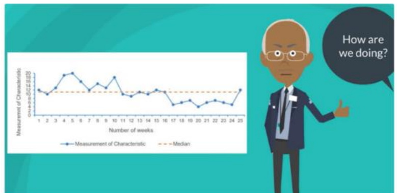
Ffigur 3: Adrodd ar Ansawdd 'Bob Amser'

Mae'r cysyniad o adrodd ar ansawdd 'bob amser' wedi cael ei ddatblygu i helpu i gyflawni rhwymedigaethau adrodd ar ansawdd y sefydliad. Mae 'bob amser' yn golygu casglu, dadansoddi, monitro a sicrhau bod gwybodaeth am ansawdd gwasanaethau ar gael