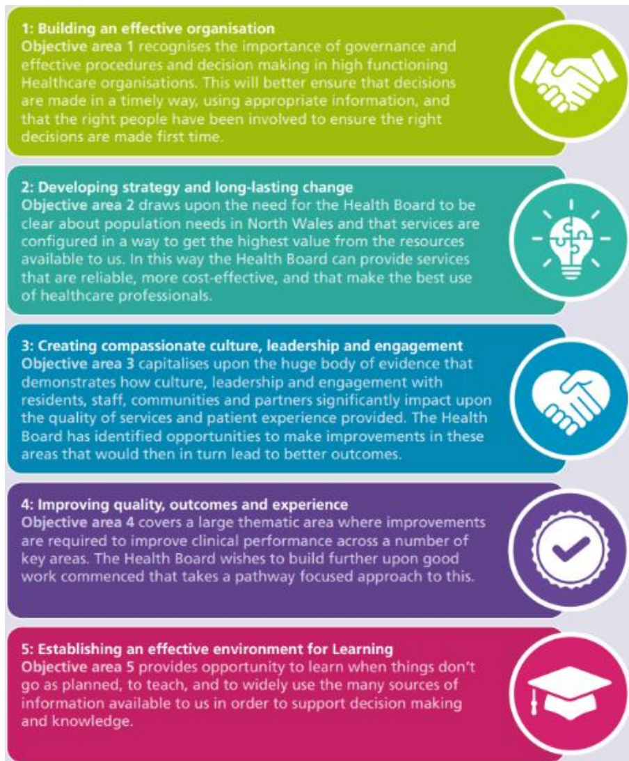
Ffigur 6: Cynllun Tair Blynedd Bwrdd Iechyd Prifysgol Betsi Cadwaladr 2023-27, 5 Amcan Strategol, 2023.

Yn ystod 2023-24, mae'r Bwrdd Iechyd wedi parhau i symud ymlaen drwy ei amcanion yn erbyn y fframwaith Mesurau Arbennig. Wrth i'r flwyddyn fynd rhagddi, mae hyn wedi ymglyfuno o gwmpas pum prif faes lle'r oedd angen gwella fwyaf. Gan gydnabod yr angen i flaenoriaethu gwelliannau yn y meysydd a arweiniodd at Fesurau Arbennig, mae craidd cynllun y Bwrdd Iechyd ar gyfer 2024-27 yn adeiladu ymhellach ar y pum maes amcan hynny: