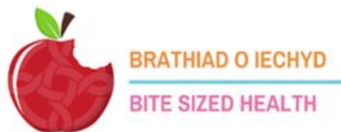
Ffigur 7: Cnoi Cil ar Iechyd, BIPBC, 2023.